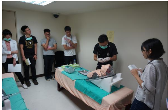
【第一站】鼻胃管置放