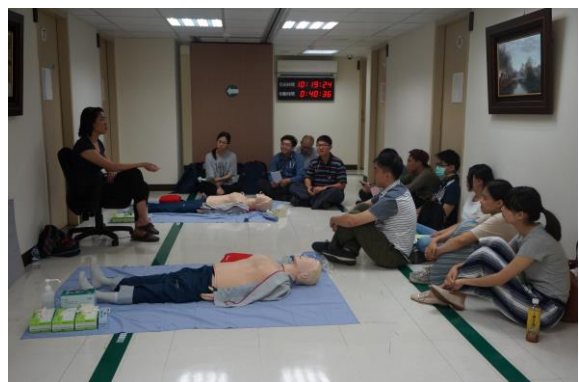
【第三站】BLS 及 AED 操作