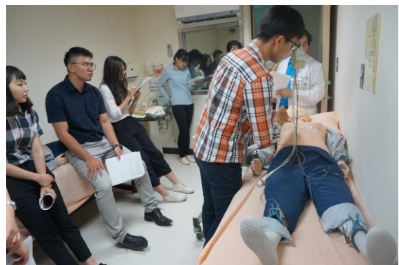
【第六站】十二導極心電圖操作、量血壓