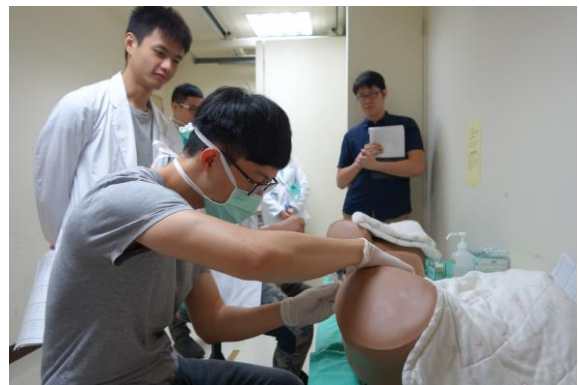
【第三站】婦科內診檢查、子宮頸抹片篩檢之操作