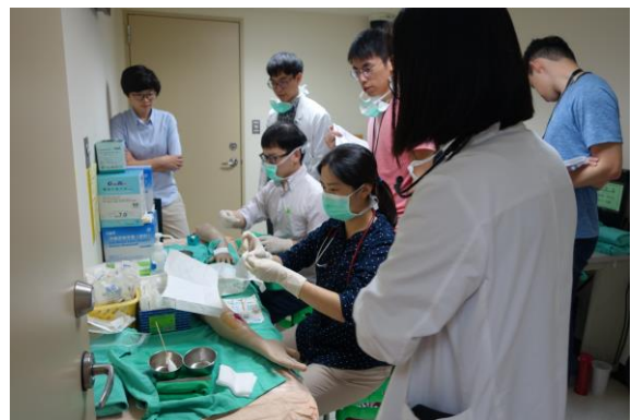
【第八站】傷口縫合、換藥、包紮、移除縫線