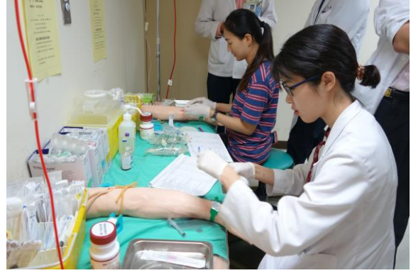
【第一站】靜脈留置針置入術、肌肉注射、靜脈穿刺及血液細菌培養