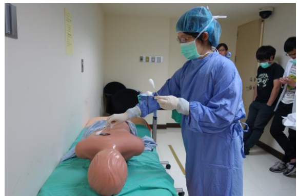
【第四站】無菌衣穿戴與手術鋪單