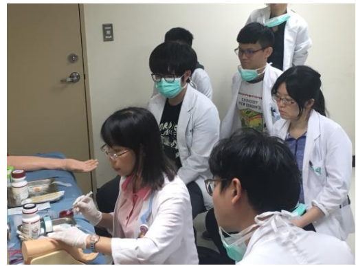
【第六站】採取動脈血、皮下注射