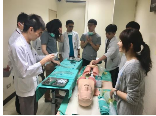
【第五站】氣管插管、呼吸道的的基本處置