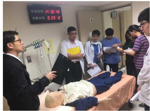
【第七站】喉拭樣採檢、十二導極心電圖操作