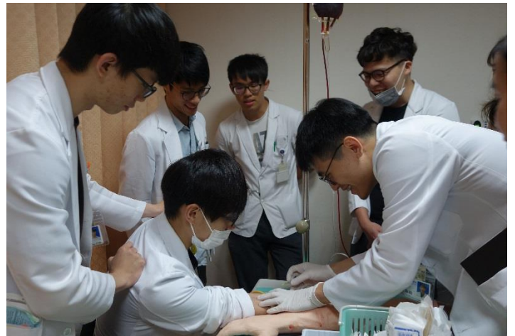
【第六站】靜脈留置針置入術