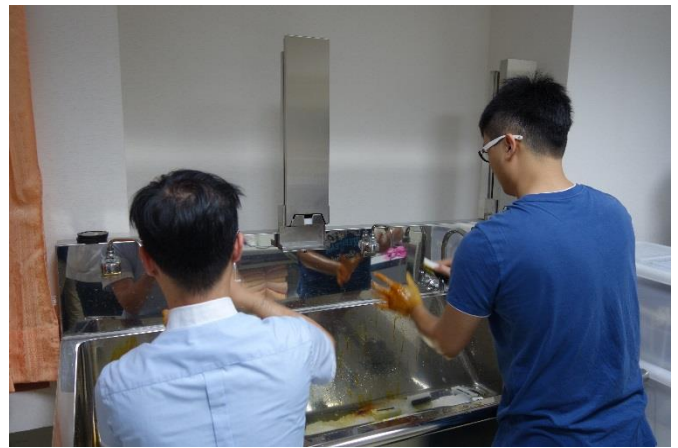
【第四站】無菌衣穿戴及無菌操作手術