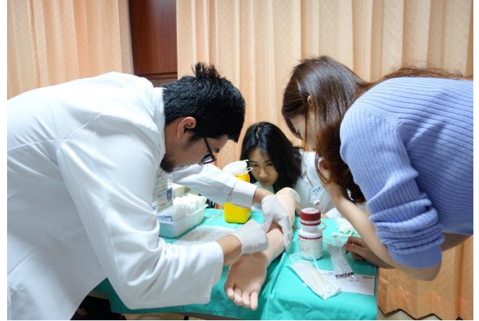
【第三站】採取動脈血