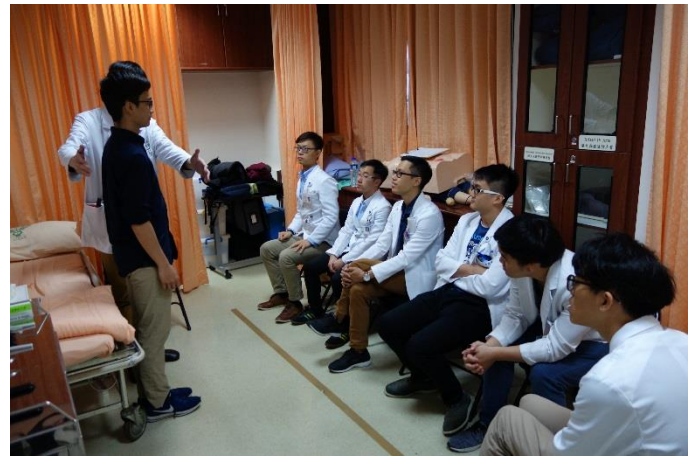
【第一站】腦神經學檢查