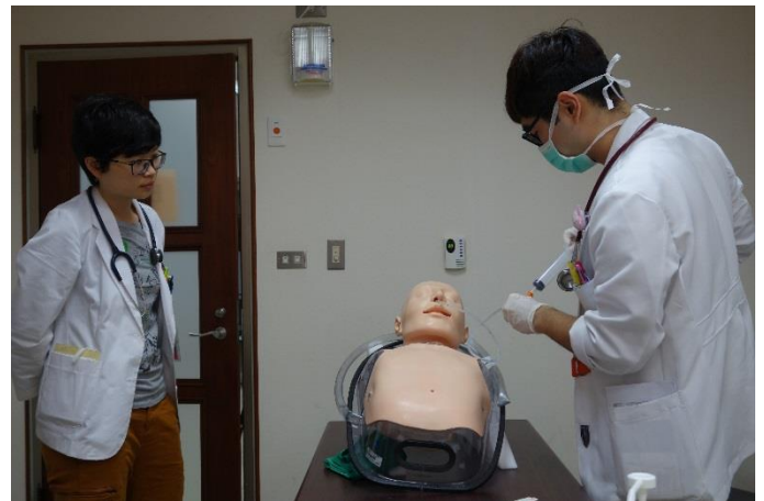
【第二站】鼻胃管置入