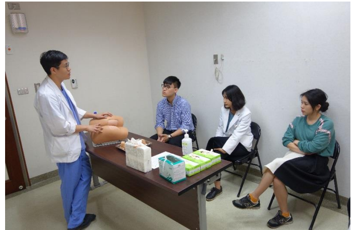
【第八站】外科直腸理學檢查