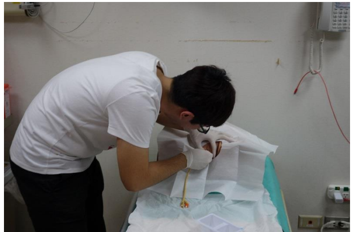
【第七站】導尿管置放