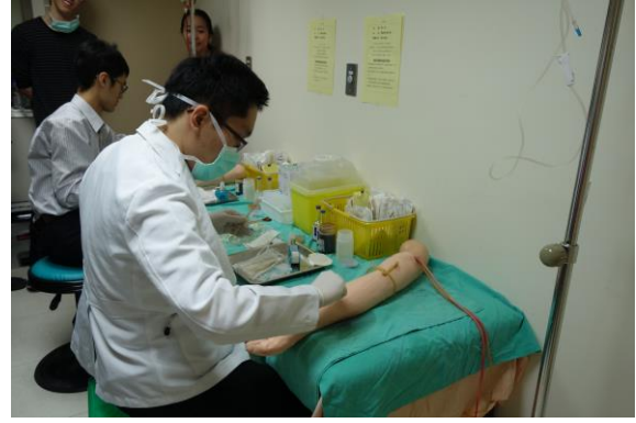
【第一站】靜脈留置針置入術、肌肉注射、靜脈穿刺及血液細菌培養