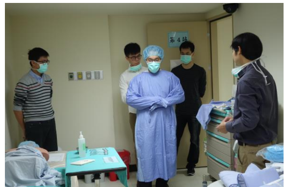
【第四站】無菌衣穿戴與手術鋪單