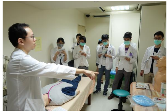
【第七站】喉拭樣採檢、十二導極心電圖操作