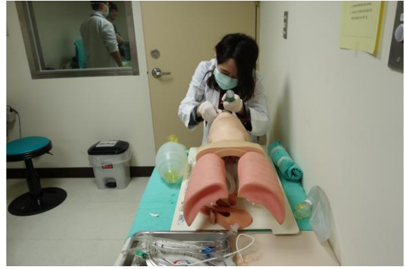
【第五站】氣管插管、呼吸道的的基本處置