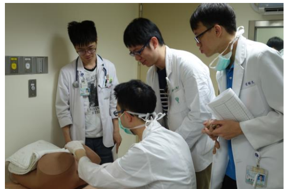
【第三站】婦科內診檢查、子宮頸抹片篩檢之操作