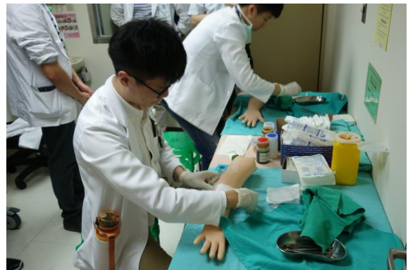
【第八站】傷口縫合、換藥、包紮、移除縫線