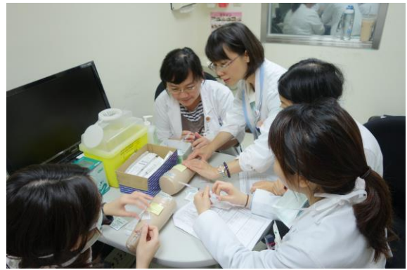
【第六站】採取動脈血、皮下注射