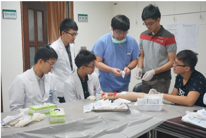
【第一站】 檢視傷口及簡易換藥