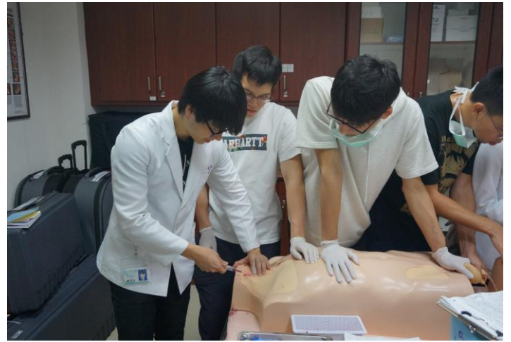
【第六站】中央靜脈導管置入