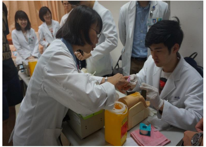
【第三站】採取動脈血