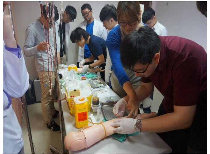
【第四站】靜脈留置針置入術