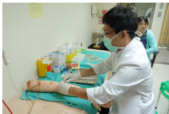
【第七站】靜脈留置針置入術