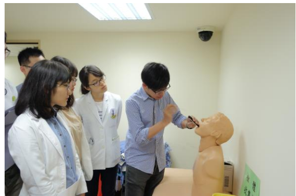
【第二站】咽喉拭樣採檢