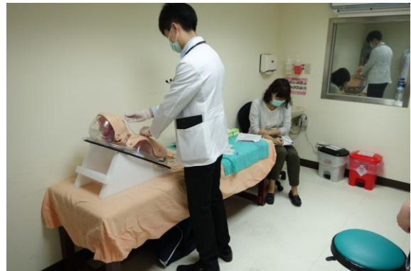
【第一站】鼻胃管置放