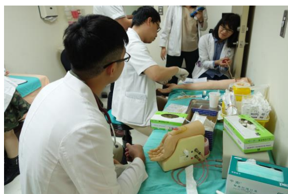
【第五站】採取動脈血