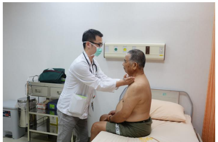
【第二站】胸腔理學檢查