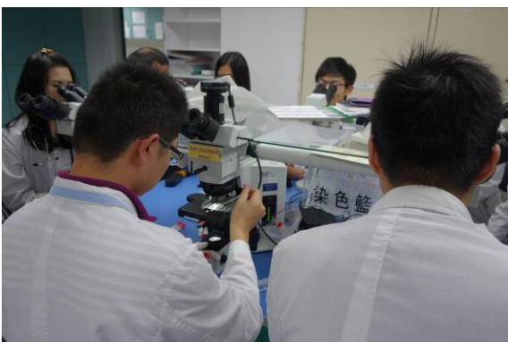
十頭顯微鏡實際操作(二)