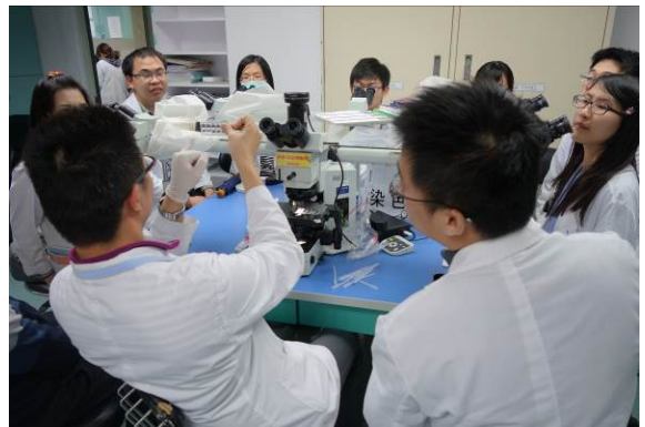
十頭顯微鏡實際操作(一)