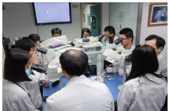
十頭顯微鏡實際操作(三)