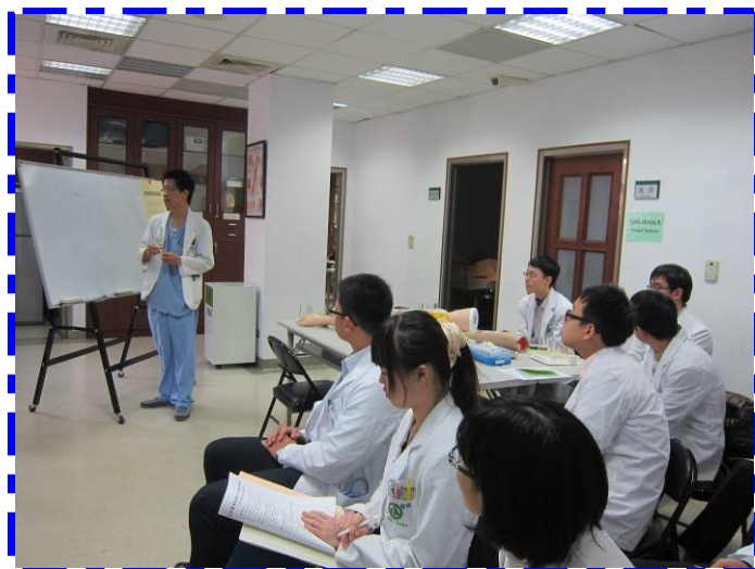
【手術安全注意事項】