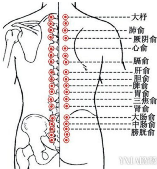
背俞穴區域的按摩