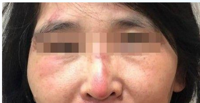
圖 2.A 小姐手術後，除了臉部擦挫傷外，無任何明顯手術疤痕