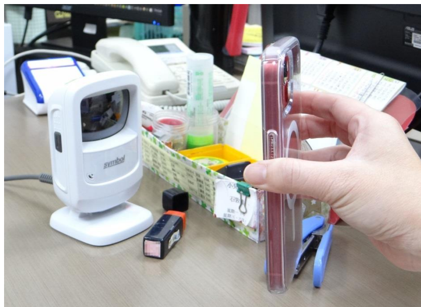
家屬透過授權使用機制，於奇美醫學中心兒科部就診時出示小朋友虛擬健保卡 QR_Code- 2

奇美醫學中心醫療事務室主任施貞伶指出：「虛擬健保卡」除了降低實體卡毀損、讀卡機故障、照片難以辨識恐遭冒用、卡片讀寫速度慢等風險，還可確保醫師能透過掃描「虛擬健保卡 QR Code」連結到病人的雲端藥歷，了解病人過往的就醫資料，做出專業的判斷，並降低重複用藥和檢查的風險，減少醫療浪費，形同實體卡插卡。並透過視訊、