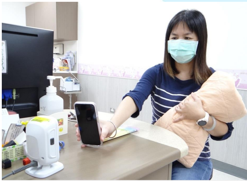
家屬透過授權使用機制，於奇美醫學中心兒科部就診時出示小朋友虛擬健保卡 QR_Code-1