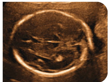
胎兒頭部 2D 超音波及 3D 超音波影像