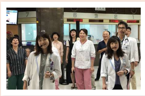
2017 奇美世界安寧日合唱快閃