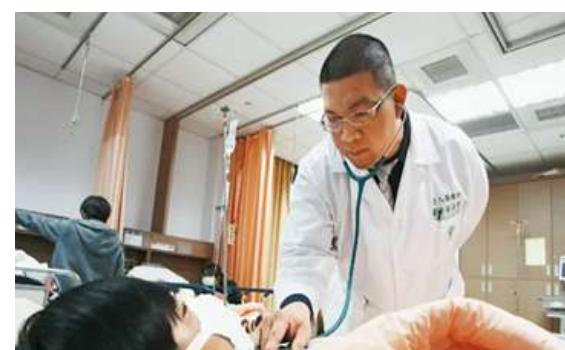
奇美急診安寧 讓人好好說再見