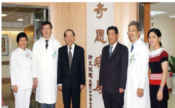
奇恩病房揭幕啟用