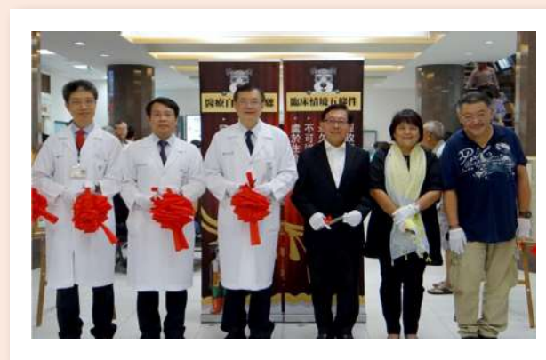
世界安寧日暨奇恩病房週年慶