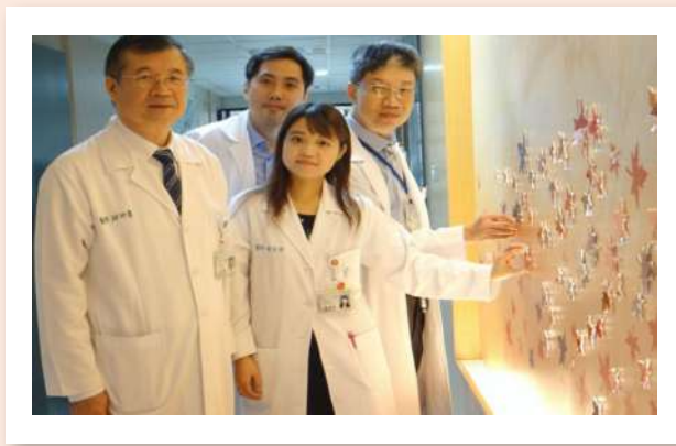
「安樂死」可能嗎？ 醫師：「臨終鎮靜」讓末期病人選擇自然離開