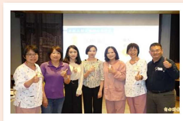
8 旬孀多重病 兒女對治療有意見 醫院攜機構助善終 和你宅再一起