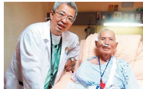
癌末老農病榻指認 25 年烏龜老友