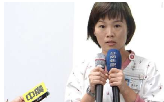
默默耕耘、無私奉獻與長期守護的提燈天使