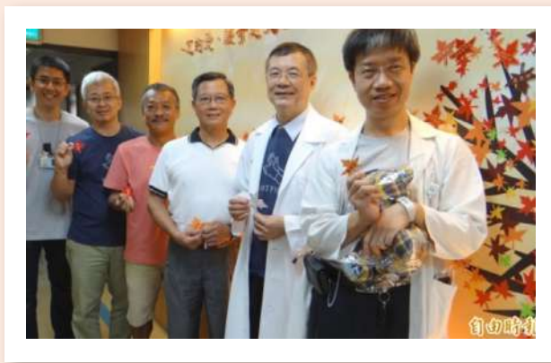
奇美醫學中心急診處增設「這個」患者家屬都安心