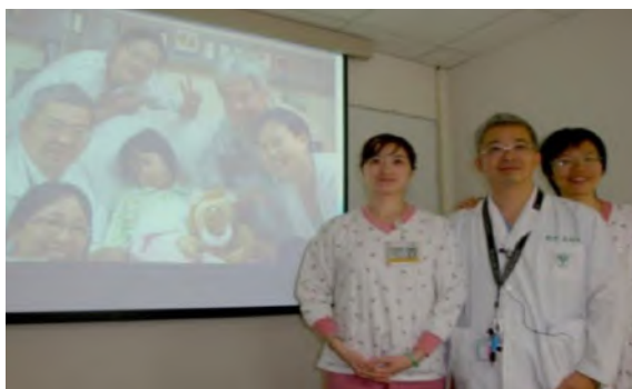
奇美新安寧運動 照顧病患身心靈