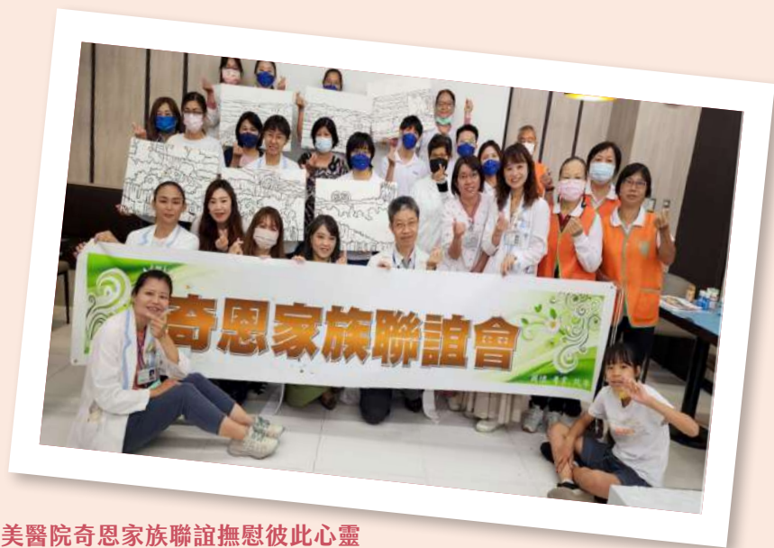
「憶」起懷念摯愛 奇美醫院奇恩家族聯誼撫慰彼此心靈