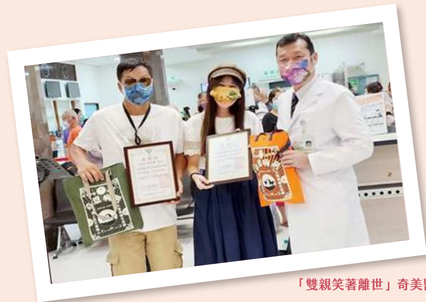
「雙親笑著離世」奇美醫安寧緩和醫療撫家屬