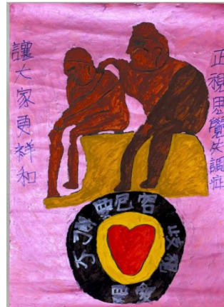
伸出關愛的手讓他走出去 去汗名人生

一旦有你我關愛的手,他的生活也能跟正常人一樣,你我是讓他逆轉勝利的主角,任務非你我莫屬,一起加油.