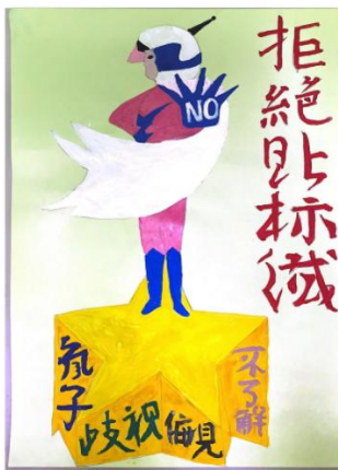
超人與星星的光芒

每個人都會生病,生病時接受治療訓練不放棄,就有超能力,星星放光芒照亮我們,加油!