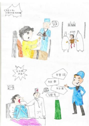
積極治療就有機會