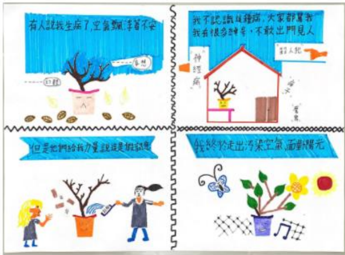
奇幻盆栽的思覺失調症

樹會生病,人也會生病,他已經無辜難過,你的一小小改變,也許可以讓他們走出來面對陽光,就像這幅畫一樣!