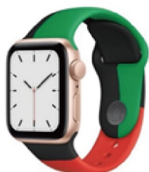
Apple Watch SE GPS 40mm