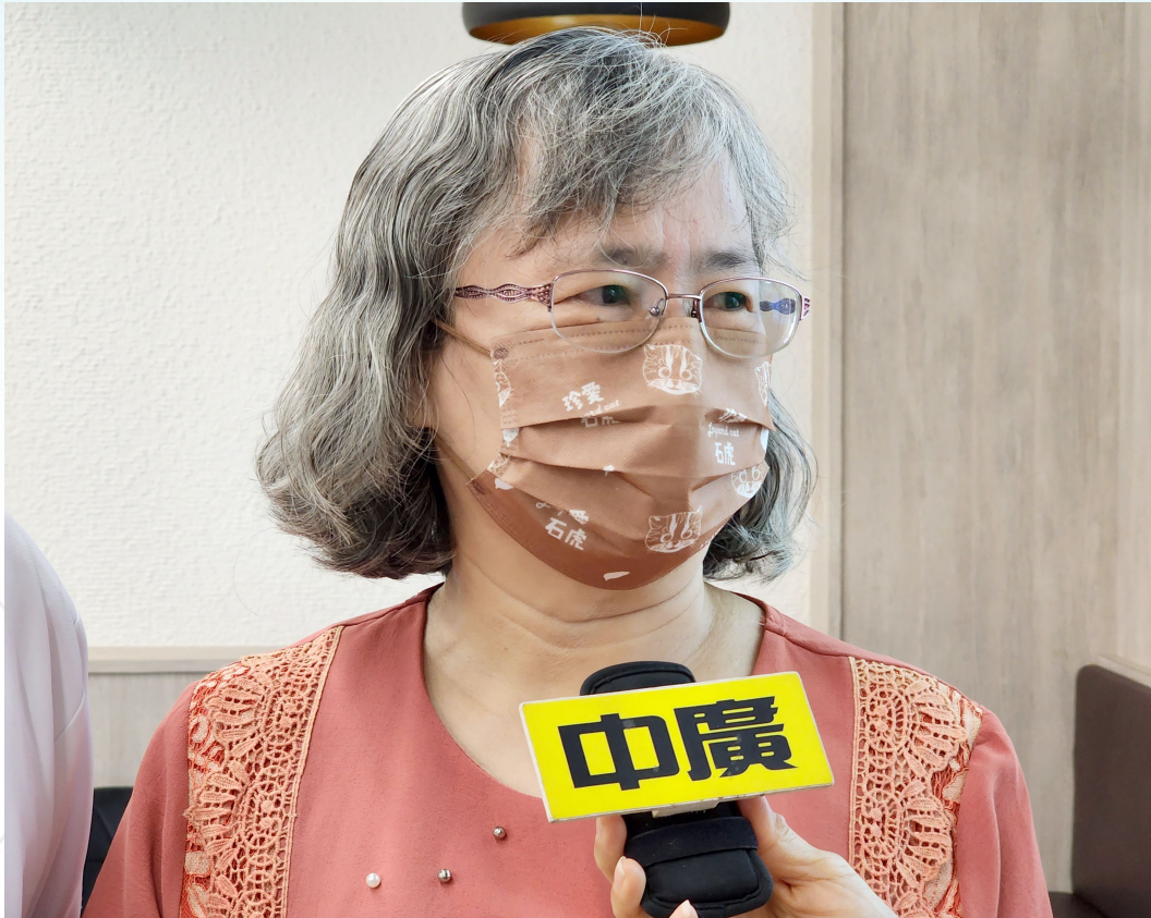
成功案例林女士記者會前接受媒體專訪