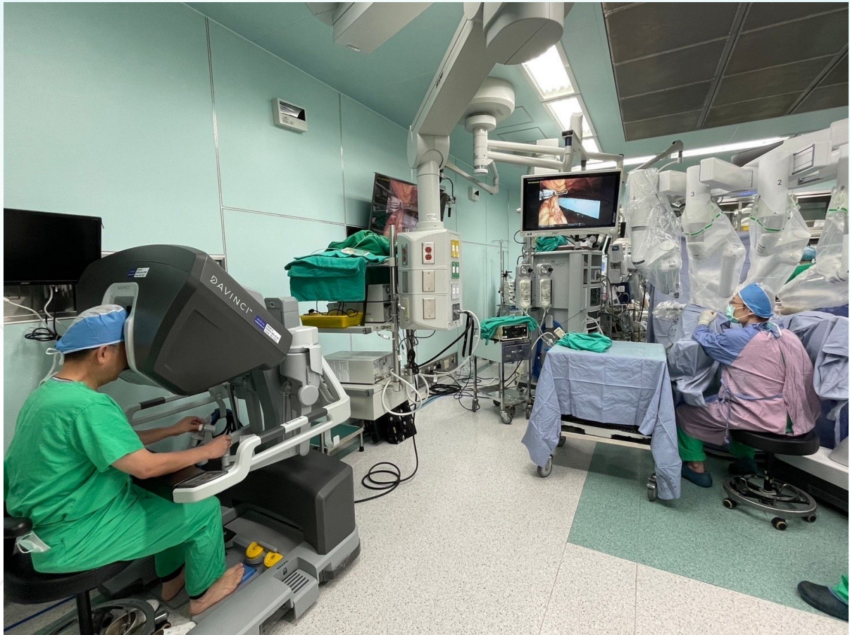
奇美醫學中心婦科達文西團隊-2

預防骨盆鬆弛脫垂的方法除了維持體重、多攝取蔬果以防便秘，年齡較大及生產過的婦女也要多練習骨盆肌肉凱格爾運動，並於做抹片檢查時，可請醫師檢查是否有骨盆鬆弛脫垂的情況。若有需要也要接受雌激素陰道投予。當出現骨盆鬆弛脫垂、合併、頻尿及尿失禁等症狀的婦女，也要提早就醫與醫師討論最符合個人的治療方式。奇美醫學中心婦科達文西團隊包括手術醫師、麻醉醫師、刷手流動護理師及負責達文心的專責護理師，麻醉團隊術前完備的準備、術中精密的監控、術後恢復的照料都是必須的。一起提供高科技醫療服務，病人及家屬完全的信賴，都是成功的關鍵。我們的口號： One Team ! One Goal ! Best Care ! (合一團隊，專一目標，最佳照顧！)