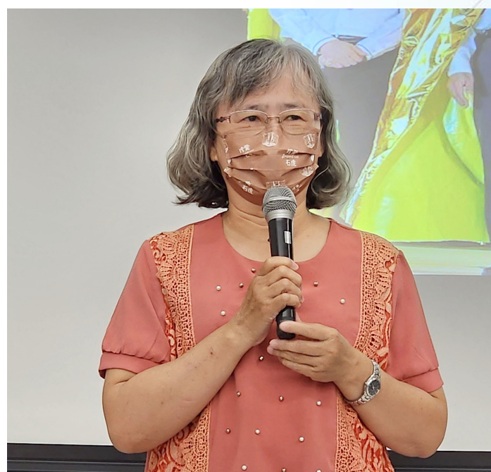
成功案例林女士於記者會上上台說明自身就醫經歷