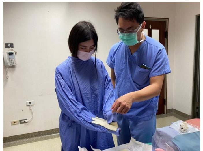
第二站-無菌衣穿戴及手術鋪單