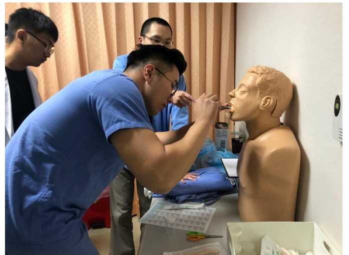
第四站-喉拭樣採檢