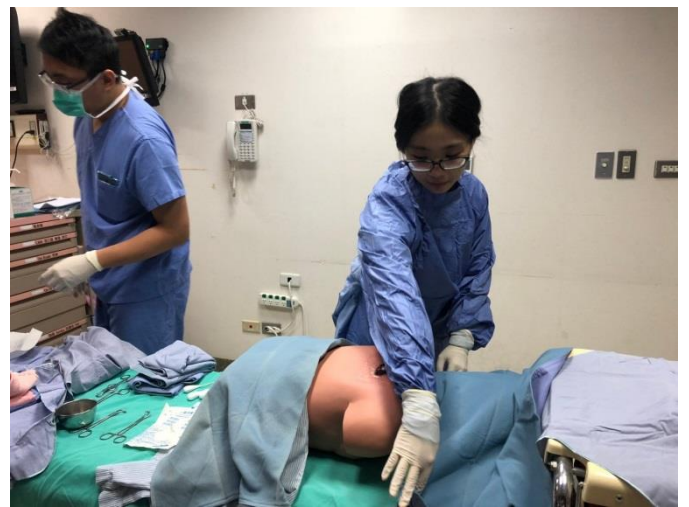
第二站-無菌衣穿戴及手術鋪單