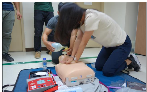
【第三站】BLS 及 AED 操作