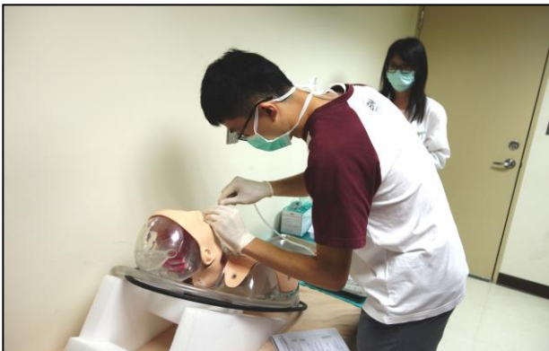
【第一站】鼻胃管置放