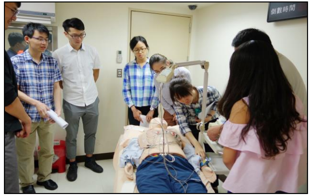
【第六站】十二導極心電圖操作、量血壓