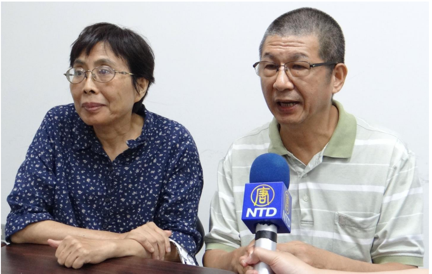
成功案例陳太太(朱女士)及陳先生記者會後接受媒體專訪-2