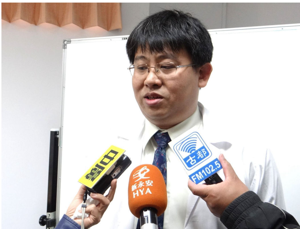
鍾玄夫醫師記者會後接受媒體專訪