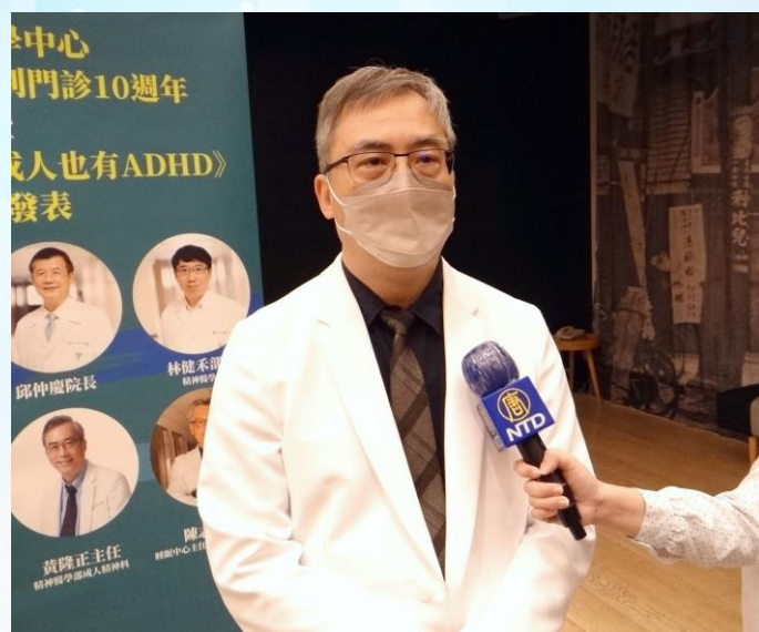
精神醫學部成人精神醫學科主任黃隆正博士 記者會後接受媒體專訪。