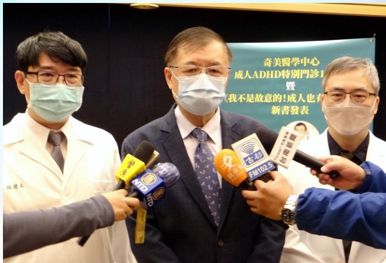
奇美醫學中心院長邱仲慶記者會前接受媒體專訪